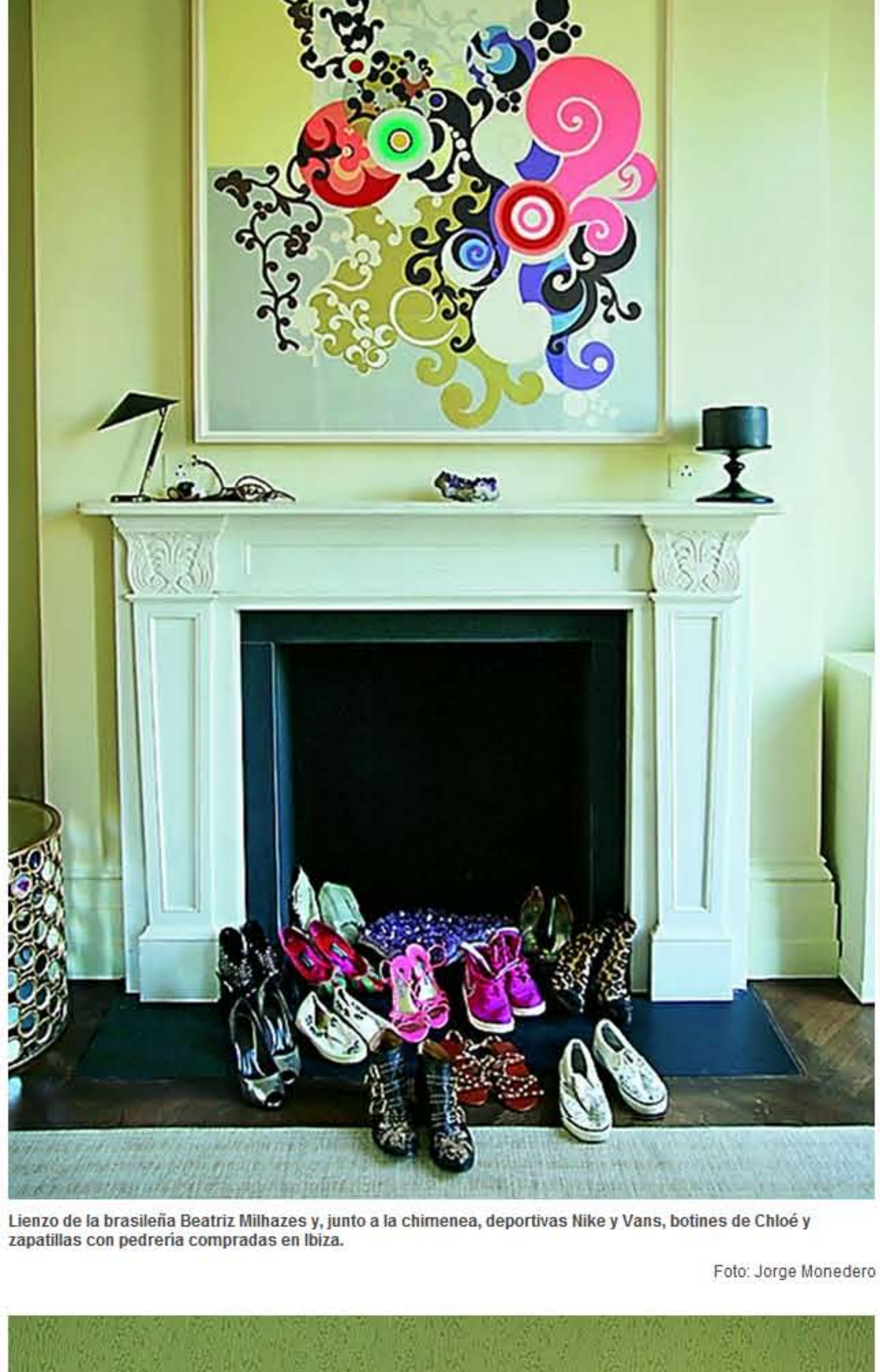
Lienzo de la brasileña Beatriz Milhazes y, junto a la chimenea, deportivas Nike y Vans, botines de Chloé y zapatillas con pedrería compradas en Ibiza.

La villa en el pueblo ibicenco de Jesús le sirve de refugio para desconectar de la vorágine londinense. «Ibiza en invierno es maravillosa; en verano no piso un restaurante: como en casa, voy de compras al pueblo y me baño con mis amigos en las rocas de Sa Punta».