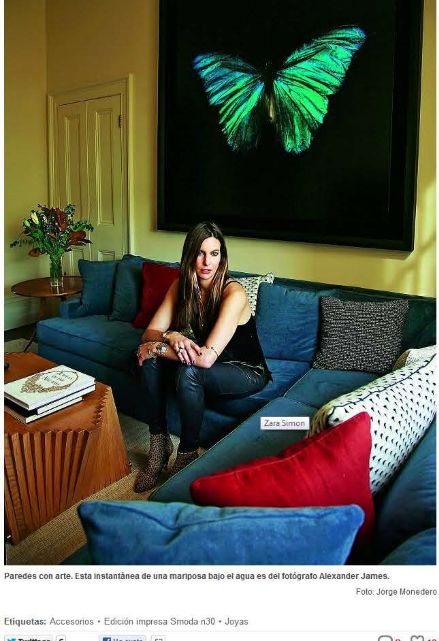
Paredes con arte. Esta instantánea de una mariposa bajo el agua es del fotógrafo Alexander James.

BRENDA OTERO | 15 DE ABRIL DE 2012 | 00:18H.